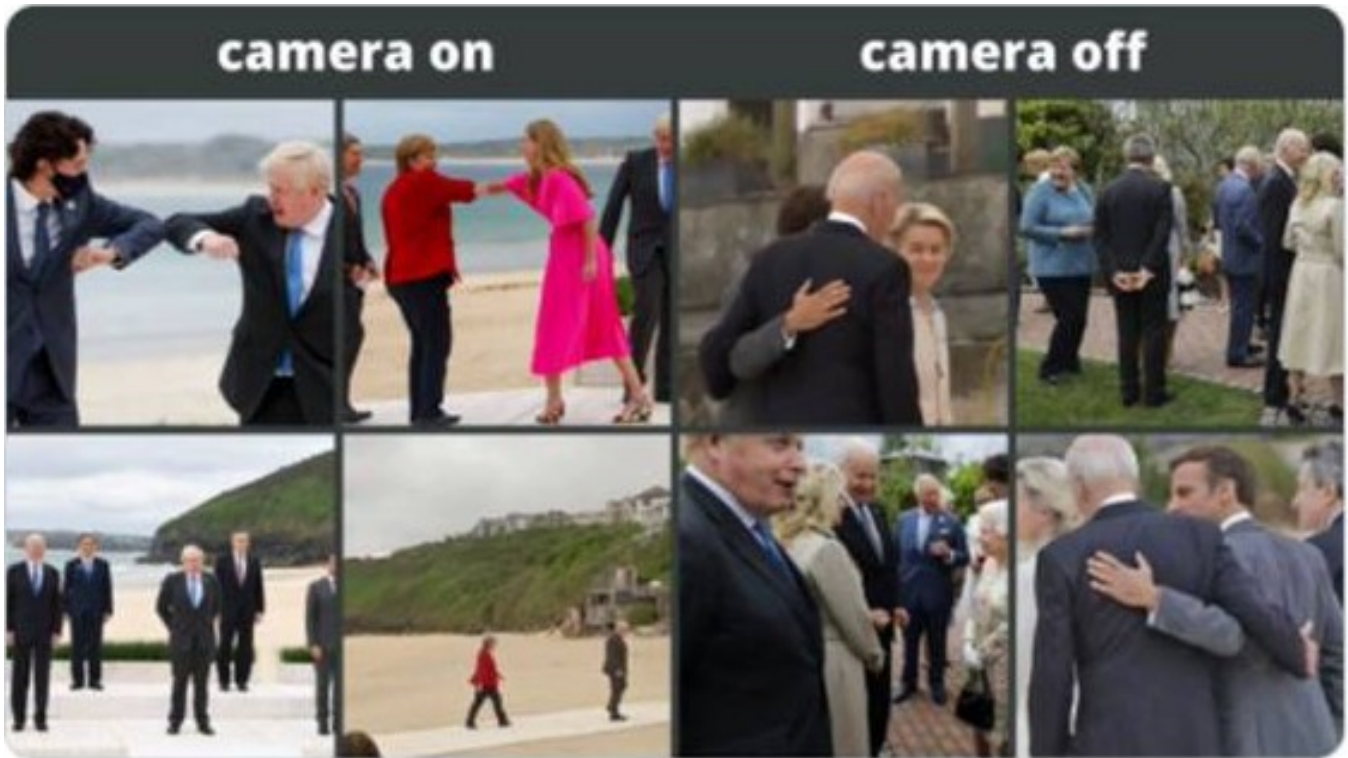
Da wird man wütend.